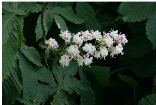
Bloesem van de paardenkastanje

Er komen veel spechten voor op het landgoed. Je hoort ze eerder dan dat je ze ziet door hun geroffel op een boomstam. Een ander vogeltje, de boomklever, kraakt vaak een leegstaand spechtenhol. Hij maakt dan wel met modder de toegang tot het nest kleiner, zodat rovers niet kunnen inbreken. Vleermuizen jagen in de schemering boven de vijver naar prooi. Eenden en andere watervogels strijken neer op het water.